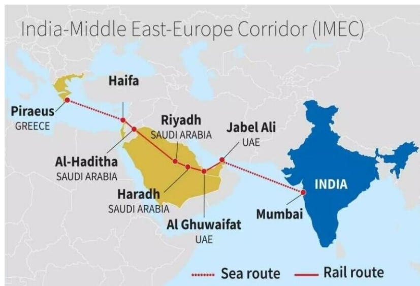
شکل ۳. کریدور آی‌مک

در دهم سپتامبر ۲۰۲۳ در نشست گروه ۲۰، جو بایدن رئیس‌جمهور وقت آمریکا و هم‌پیمانانش از طرحی برای ایجاد خط راه‌آهن و گذرگاهی برای متصل کردن هند به خاورمیانه و اروپا خبر دادند. این پروژه شامل هند، عربستان، امارات، اردن، رژیم صهیونیستی و اتحادیه اروپا است. کریدور هند-خاورمیانه-اروپا؛ یک مسیر کشتیرانی است که بمبئی و موندرا (گجرات) را به امارات و یک شبکه ریلی که امارات، عربستان سعودی و اردن را به بندر حیفا رژیم صهیونیستی متصل می‌کند تا به سواحل دریای مدیترانه برسد. حیفا سپس از طریق دریا به بندر پیرئوس در یونان و در نهایت به اروپا متصل می‌شود. طبق برخی برآوردها، کالاها می‌توانند با استفاده از مسیر جدید، ۴۰ درصد سریع‌تر از کانال سوئز، از بمبئی به اروپا برسند و هزینه را ۳۰ درصد کاهش دهند (Aboudouh, 2023).