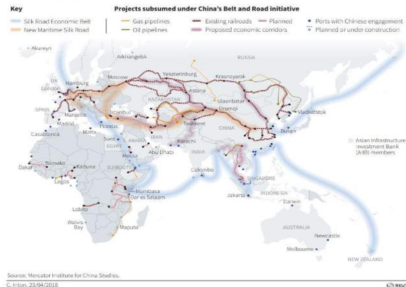
FIGURE 1. REVIVING THE SILK ROAD