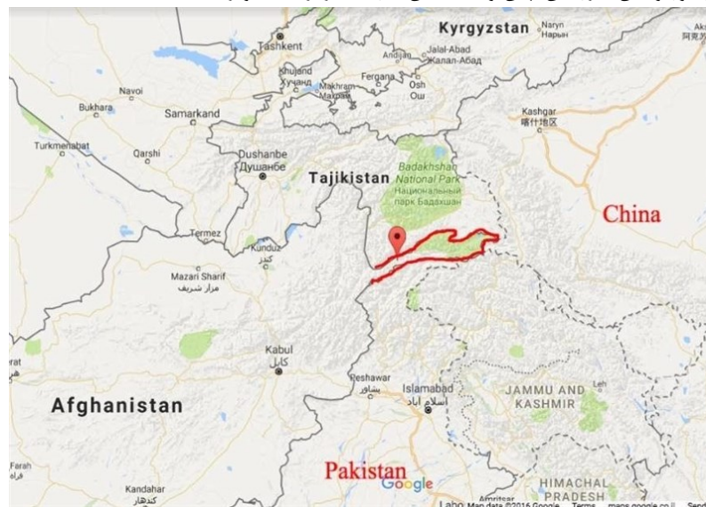
نقشه شماره ۵. ۱: کریدور واخان، مرز چین و افغانستان

است، چین از بابت احتمال پیوند و همکاری بین ایغورها با داعش و طالبان در افغانستان احساس خطر می‌کند. داعش خراسان ۱ در سال ۲۰۱۵ اعلام موجودیت نمود. این گروه به این دلیل که معتقد است طالبان با چین علیه مسلمانان اوغور متحد شده، آنها را خائن نامیده و به نبرد پرداخته‌اند. در چنین وضعیتی امکان ملحق شدن ایغورها به داعش خراسان زیاد است (Monavari et al, 2022: 83). همچنین باید به گروه «تحریک طالبان پاکستان» ۲ اشاره کرد که با گروه داعش اتحادی موقت داشته و بویژه بعد از خروج امریکا از افغانستان بر فعالیت خود بر ضد منافع چین در پاکستان افزوده‌اند. به دلیل اینکه این گروه مورد حمایت طالبان هستند، نگرانی‌های چین افزایش یافته است (Salimifar et al, 2021: 773). چین قصد دارد از گسترش بنیادگرایی، افراط‌گرایی و تروریسم اسلامی جلوگیری کند و در این جهت مطالبه‌اش از طالبان مهار شبه نظامیان اوغور مستقر در افغانستان و یا تحویل آنها به چین است. در نقشه شماره ۵-۱، کریدور واخان، مرز بین چین و افغانستان با رنگ قرمز به تصویر کشیده شده است.