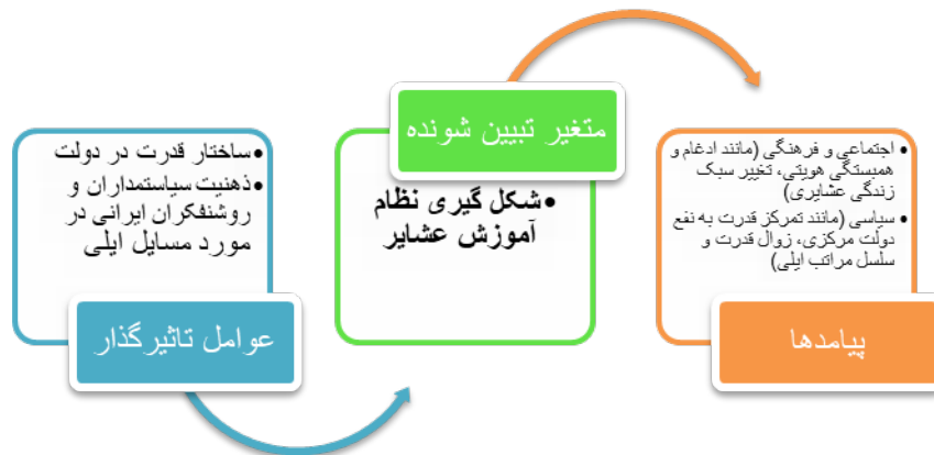
شکل ۱. عوامل تأثیرگذار و پیامدهای مهم نظام آموزش عشایری در ایران

ایلی، ادغام عشایر و همبستگی هویتی بوده است. در شکل ۱، رابطه بین عوامل تأثیرگذار بر شکل‌گیری نظام آموزشی عشایر و مهم‌ترین پیامدهای آن به نمایش گذاشته شده است.